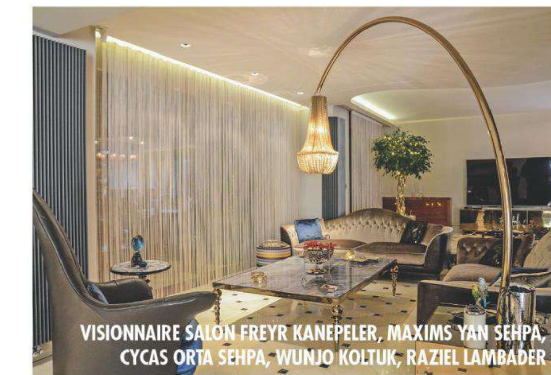
VISIONNAIRE SALON FREYR KANEPELER, MAXIMS YAN SEHPA, CYCAS ORTA SEHPA, WUNJO KOLTUK, RAZIEL LAMBADER

Modernize edilmiş altın ve gümüş renkli metal, cam ve taş aksesuarlar gruplanarak Visionnaire imzalı Archos büfe üzerinde zengin ve derin renk geçişleri yaratıyor. Mücevher ışıltısına vurgu yapan aksesuarlar, ışıltılı bir hikaye yaratıyor. Salonda yer alan Visionnaire imzalı Freyr kanepesi ise dekorasyon kurgusunun konfor anlayışını sergileyen en önemli öğe... Kanepeye uyumlu olarak tasarlanan Cycas sehpa da etkileyici Raziel lambaderin görkemli duruşuna ahenkli bir şekilde eşlik ediyor. Wunjo koltuk ve Maxims yan sehpa elegan ve minimalist çizgisiyle evin ruhunu değiştirmekte.