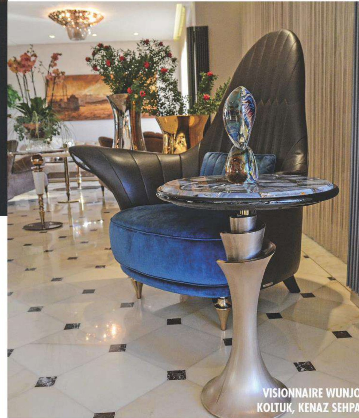
VISIONNAIRE WUNJO KOLTUK, KENAZ SEHPA