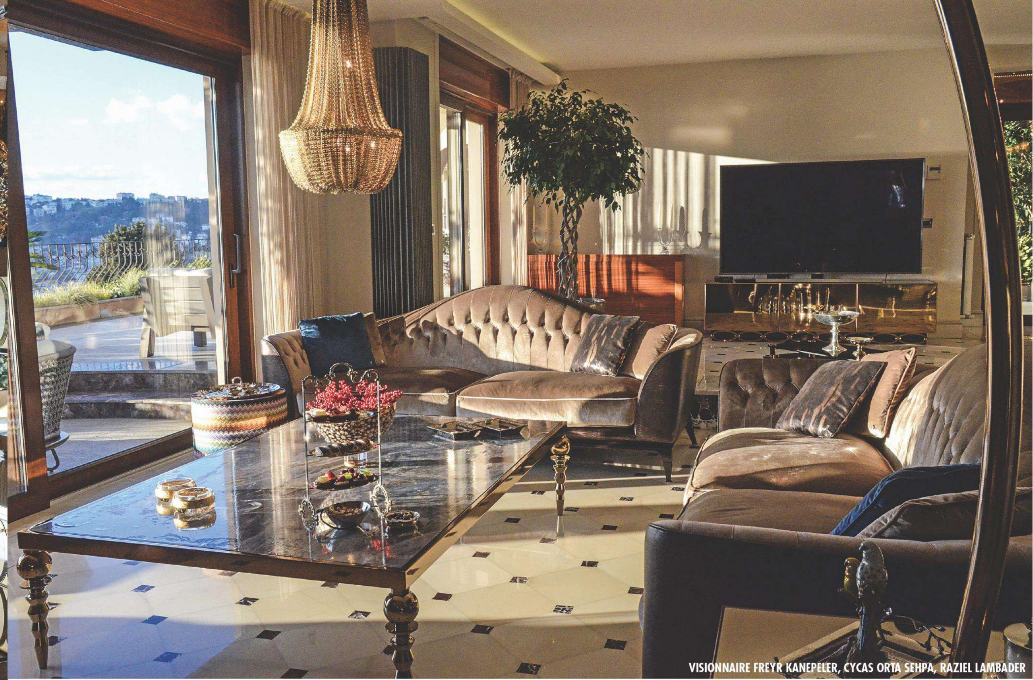
VISIONNAIRE FREYR KANEPELER, CYCAS ORTA SEHPA, RAZIEL LAMBADER