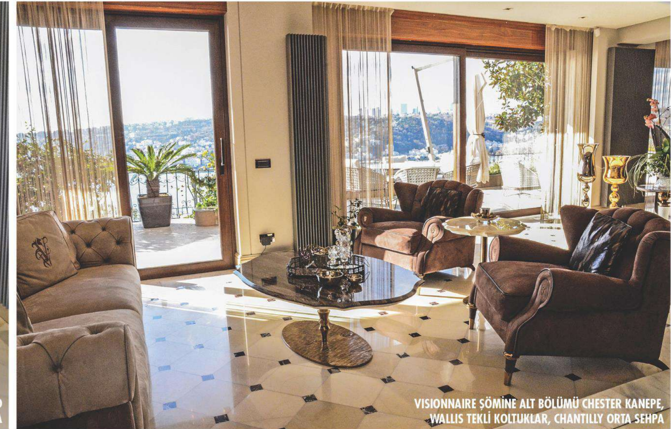
VISIONNAIRE ŞÖMİNE ALT BÖLÜMÜ CHESTER KANEPE, WALLIS TEKLİ KOLTUKLAR, CHANTILLY ORTA SEHPA