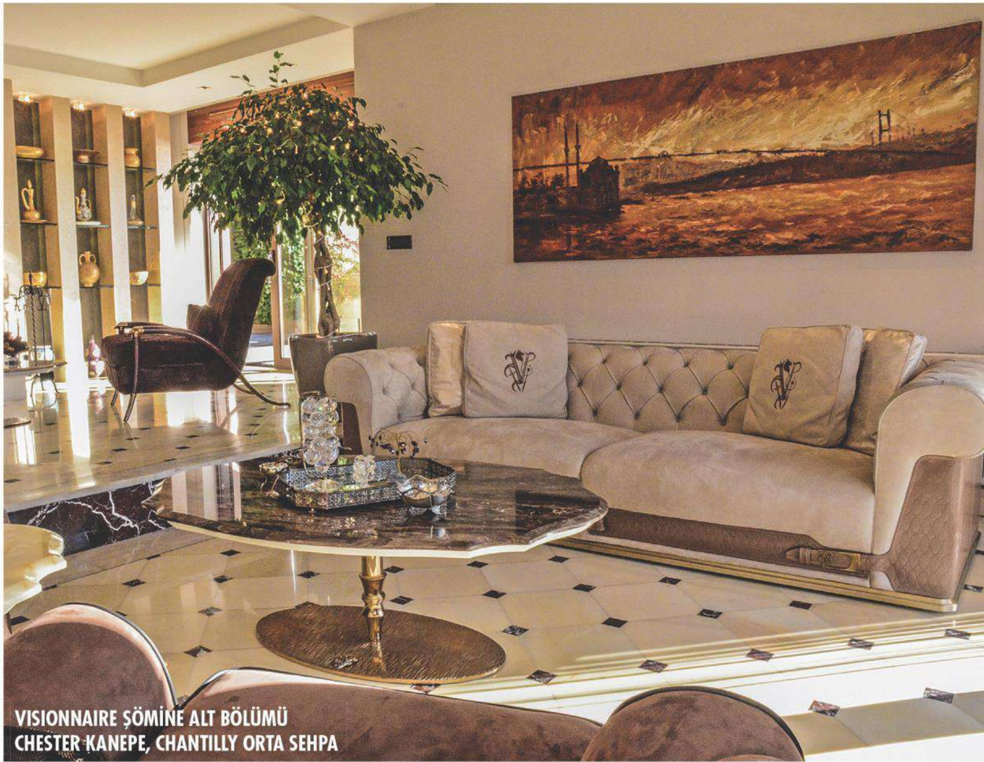
VISIONNAIRE ŞÖMİNE ALT BÖLÜMÜ CHESTER KANEPE, CHANTILLY ORTA SEHPA