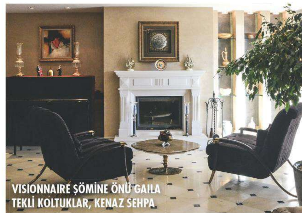
VISIONNAIRE ŞÖMİNE ÖNÜ GAILA TEKLİ KOLTUKLAR, KENAZ SEHPA

Soft renkler ve natürel malzemeler Doğallığı ve konforu seven ev sahiplerinin önceliği, soft renkler ve natürel malzemeler olmuş. Salon,