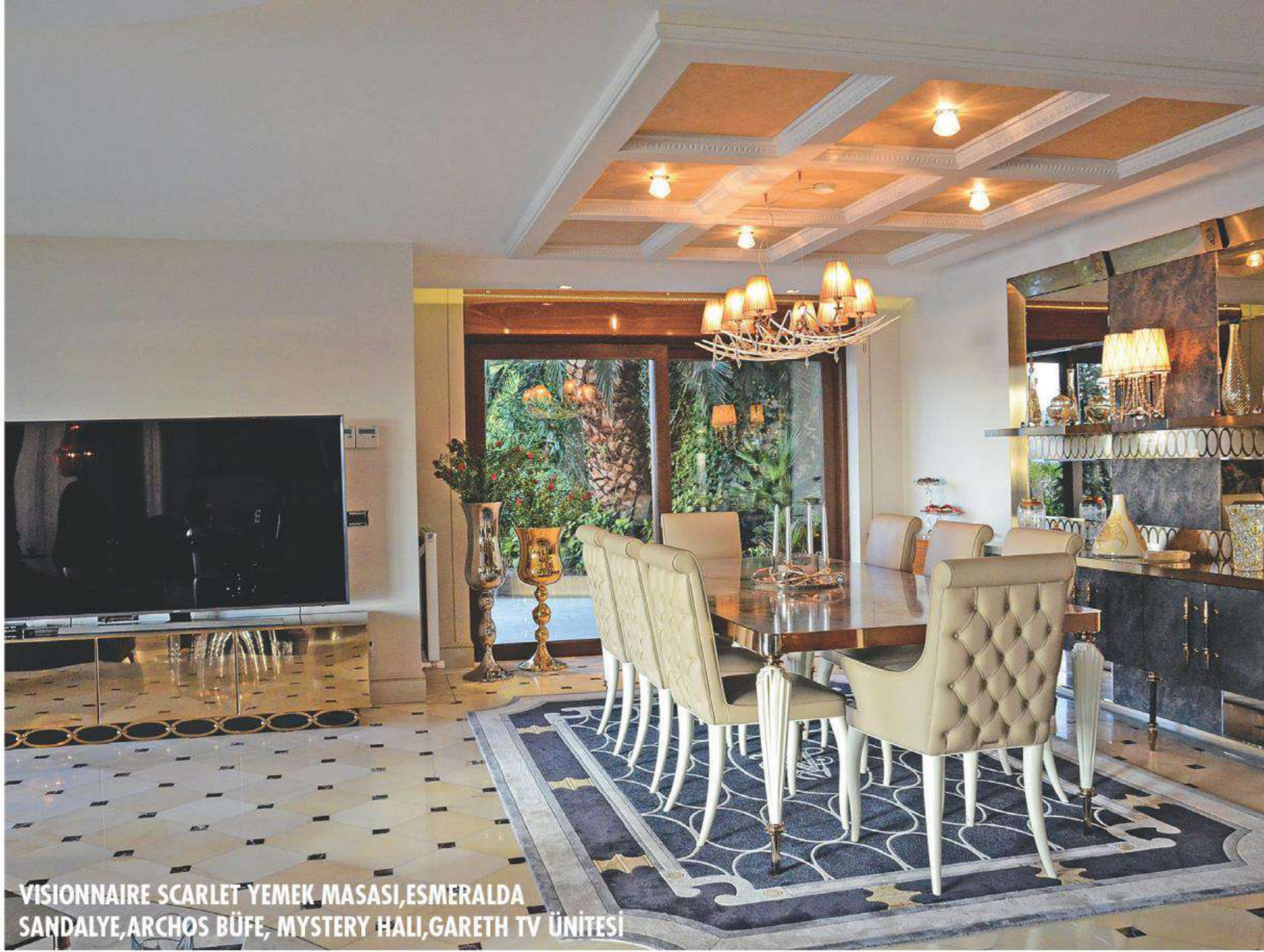
VISIONNAIRE SCARLET YEMEK MASASI, ESMERALDA SANDALYE, ARCHOS BÜFE, MYSTERY HALI, GARETH TV ÜNİTESİ